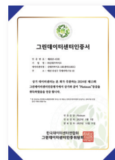
그린데이터센터 Platinum 인증